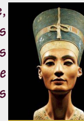
Néfertiti-XIV e siècle av JC

A u-delà de son mystère, l'art égyptien se distingue par son esthétique singulière, définie par des lignes épurées, des symboles forts et une harmonie visuelle qui a traversé les âges.