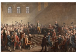
Assemblée des 3 ordres-Vizille

Ensuite, découvrons le plan local. Comment ce moment a-t-il été vécu chez nous, avec quelles conséquences ?