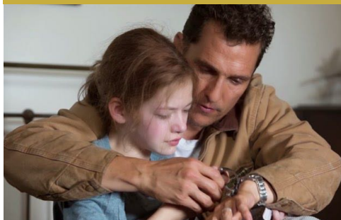
« Interstellar » de Christopher Nolan