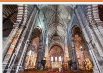
Notre Dame du Réal

. Le patrimoine écrit et oeuvres sur papier : archives et estampes