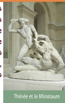
Thésée et le Minotaure

Loins d'être de simples légendes destinées à divertir, ils ont cherché à témoigner d'une conception du monde, à la fois très proche et très éloignée de la nôtre.