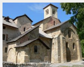
Abbaye du Boscodon